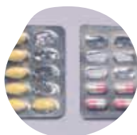
COMPRIMÉS, GÉLULES, POUDRES...

La récupération des médicaments non utilisés à usage humain par les pharmaciens est une obligation légale depuis 2007.