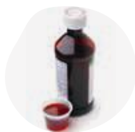
SIROPS ET SOLUTIONS BUVABLES