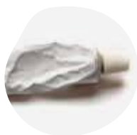
POMMADES, CRÈMES ET GELS...